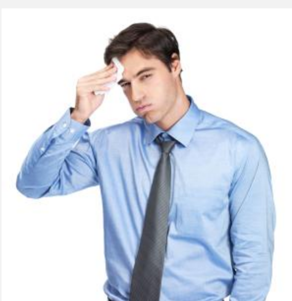
SudorFrente.jpg (10.59 KiB) Visto 331 veces

¿Te ha gustado este hilo? Retweetealo para que se sume mas gente a la conversacion!